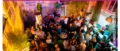
Grenouilles Productions Entrée libre de 16h à minuit!

À quelques pas du Tap Castille, Filmer le travail vous donne rendez-vous tout au long de la semaine à Grenouilles Productions!