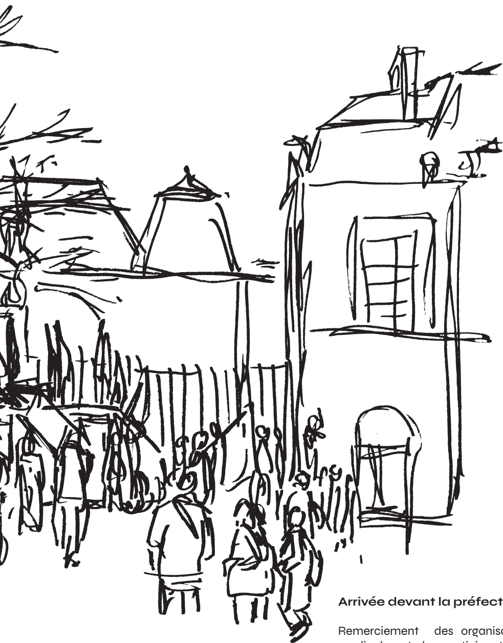
Arrivée devant la préfecture.

Remerciement des organisations syndicales et des participants des autres villes pour leur venue, puis séparation du cortège, certains rentrent chez eux, d'autres (peu) prennent la direction du TAP.