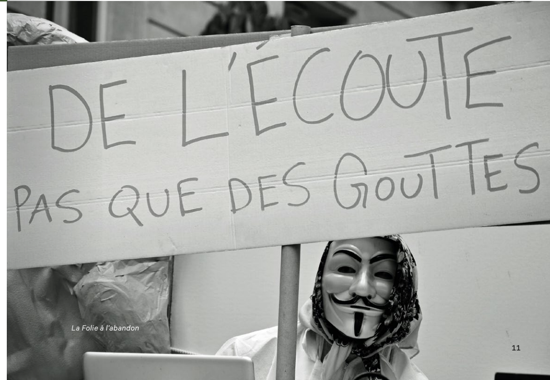
La Folie à l'abandon

20h30 | TAP théâtre | durée : 1h40 | tarifs de 3,50€ à 27€ [p. 6]