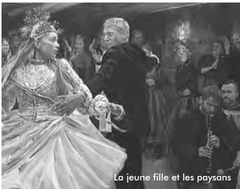
La jeune fille et les paysans