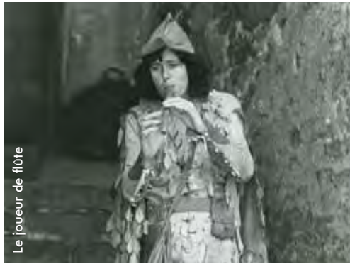
Le joueur de flûte