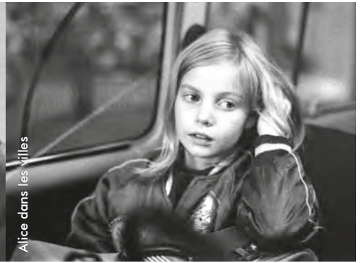
Alice dans les villes