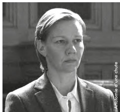
Anatomie d'une chute

Formidable portrait d'une écrivaine que tout accuse de la mort de son mari, Anatomie d'une chute n'est surtout pas un banal film de procès mais le déroulement magnifique d'une page de littérature à la Stefan Zweig. www.avoir-alire.com