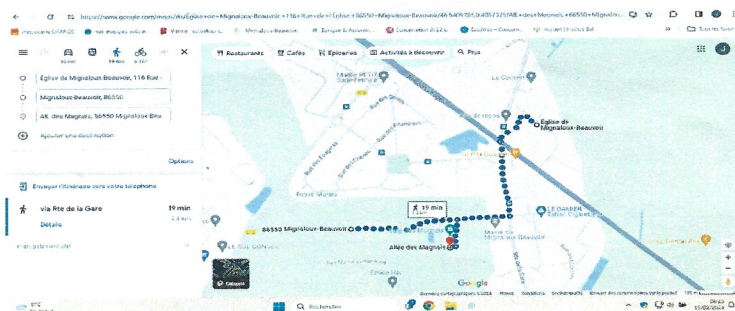
Mignaloux-Beauvoir Le coq-refuge de l'église