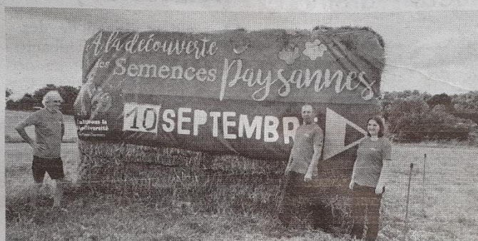
À la découverte des semences paysannes ?

Le collectif permet de trouver des variétés permettant l'autonomie. Les agriculteurs apprennent à sélectionner les graines les mieux adaptées à leurs terres qu'elles soient céréales, fourra-