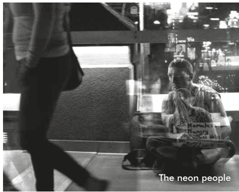
The neon people