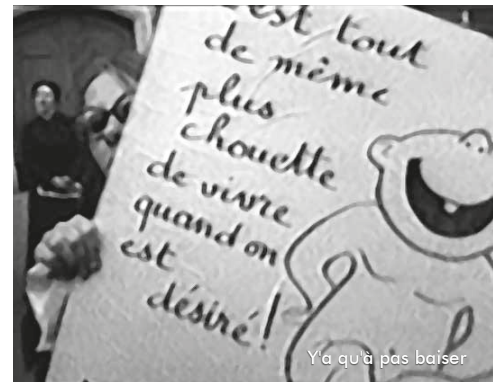
Ya qu'à pas baiser