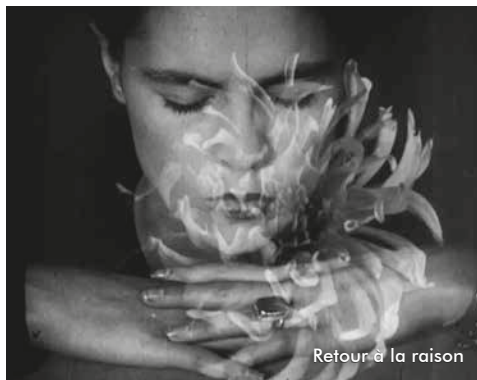
Retour à la raison