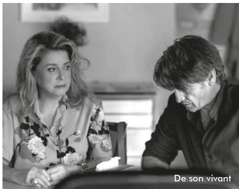
De son vivant