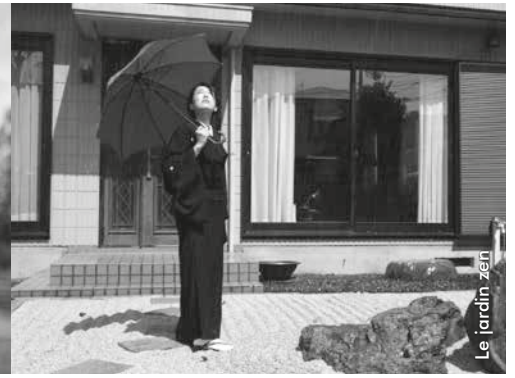
Le jardin zen