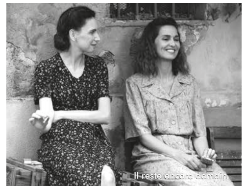
Il reste encore demain